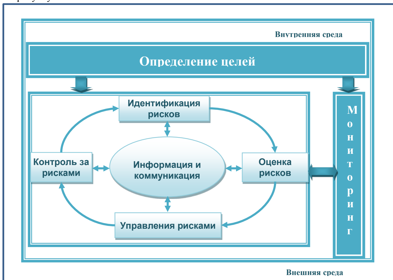
Рисунок №2 «Процесс управления рисками»

9.1. Управление рисками является постоянным, динамичным, непрерывным и циклическим процессом, в рамках которого происходит обмен информацией и коммуникация между участниками СУР. Процесс функционирования СУР состоит из этапов согласно рисунку №2: